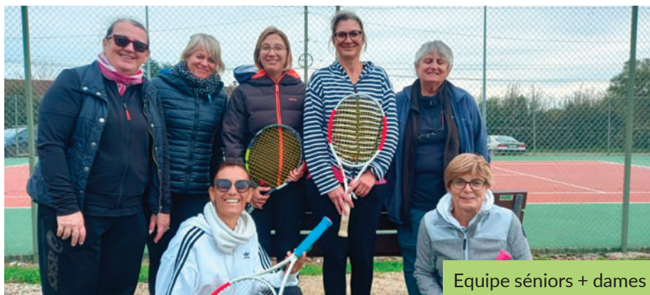
Equipe séniors + dames