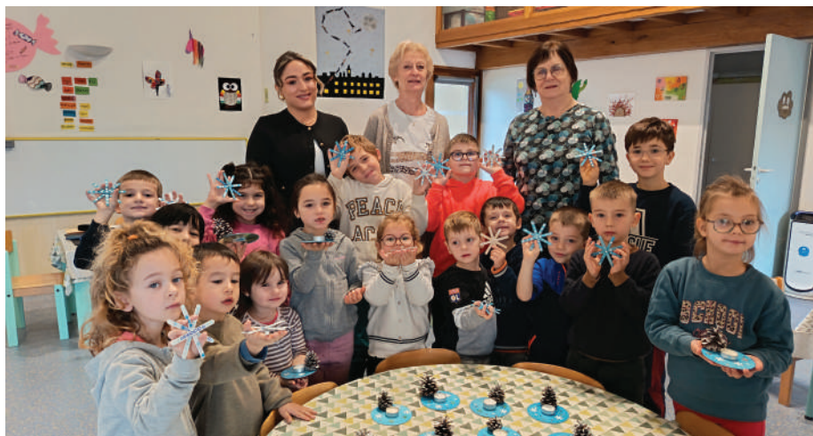
Décorations fabriquées par nos bambins pour nos aînés