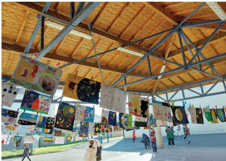
La grande lessive, 7 novembre 2025

Nous pensons et espérons qu'il s'agit d'un mauvais passage. En effet avec seulement 15 CM2 en 2026/27, la tendance devrait s'inverser, d'autant plus que les projets immobiliers sur les 2 communes devraient enfin