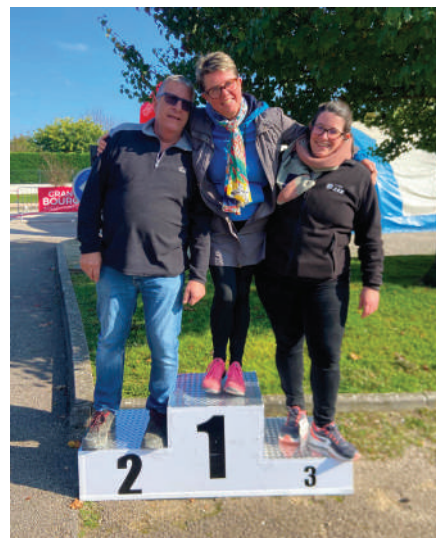
Des membres actifs !

Pour finir l'année en beauté, Conf'Anime vous donne rendez-vous le 20 décembre pour une soirée de Noël féérique. Le Père Noël fera halte à Confrançon pour prendre la pose avec petits et grands, tandis qu'un concert gospel aux accents joyeux et lumineux viendra enchanter la soirée.