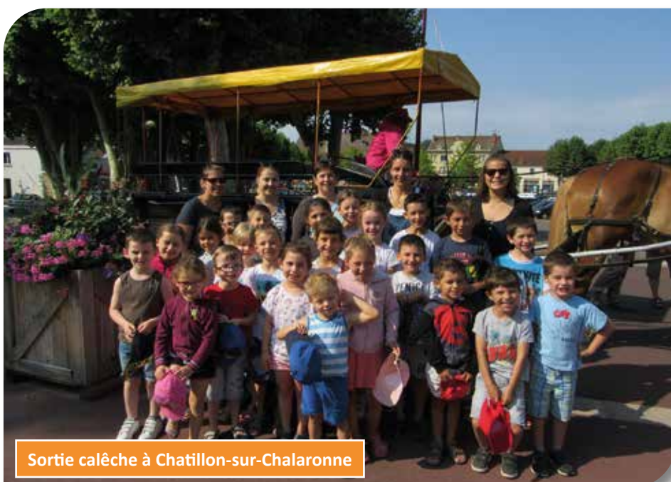
Sortie calèche à Chatillon-sur-Chalaronne