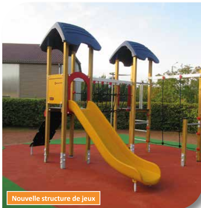
Nouvelle structure de jeux