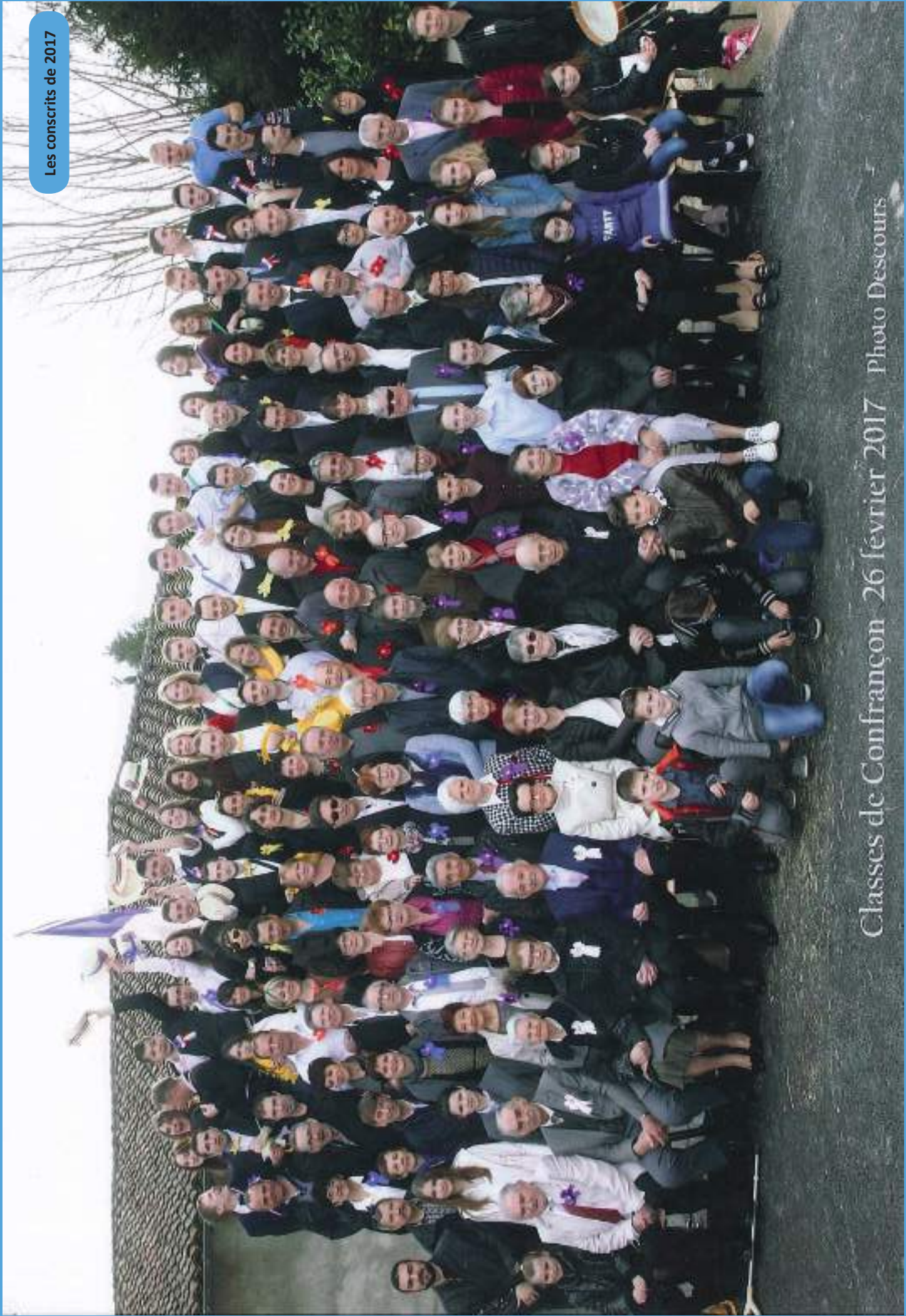
Classes de Confranco 26 février 2017