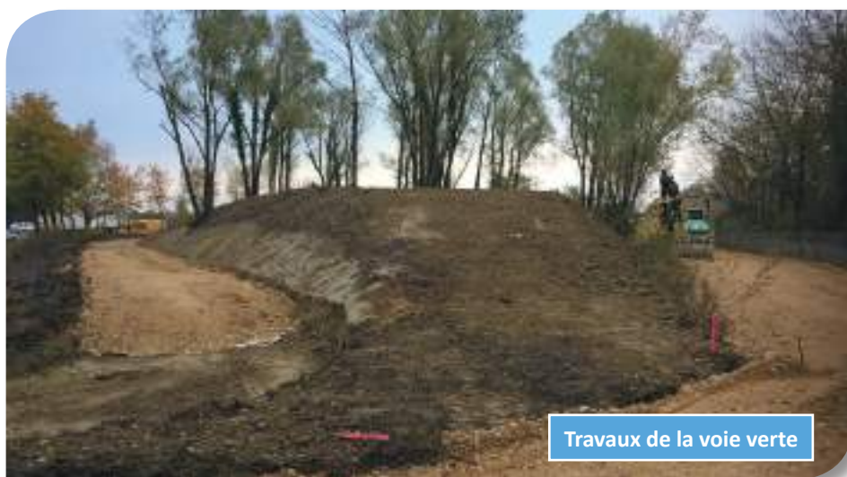
Travaux de la voie verte

Chalon-sur-Saône pour y créer une voie verte. Dans un premier temps, les travaux concernent un premier tronçon de 11,5 km jusqu'à Jayat avant à terme un prolongement vers la base de loisirs de Bouvent à Bourg-en-Bresse. La voie sera réservée aux piétons et aux cyclistes qui pourront circuler en toute sécurité.