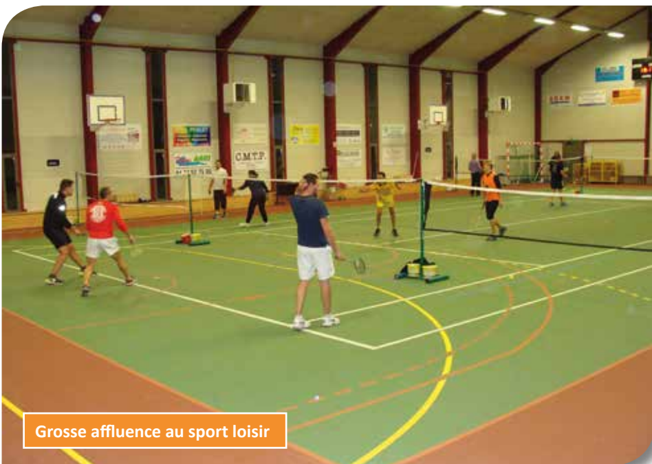
Grosse affluence au sport loisir