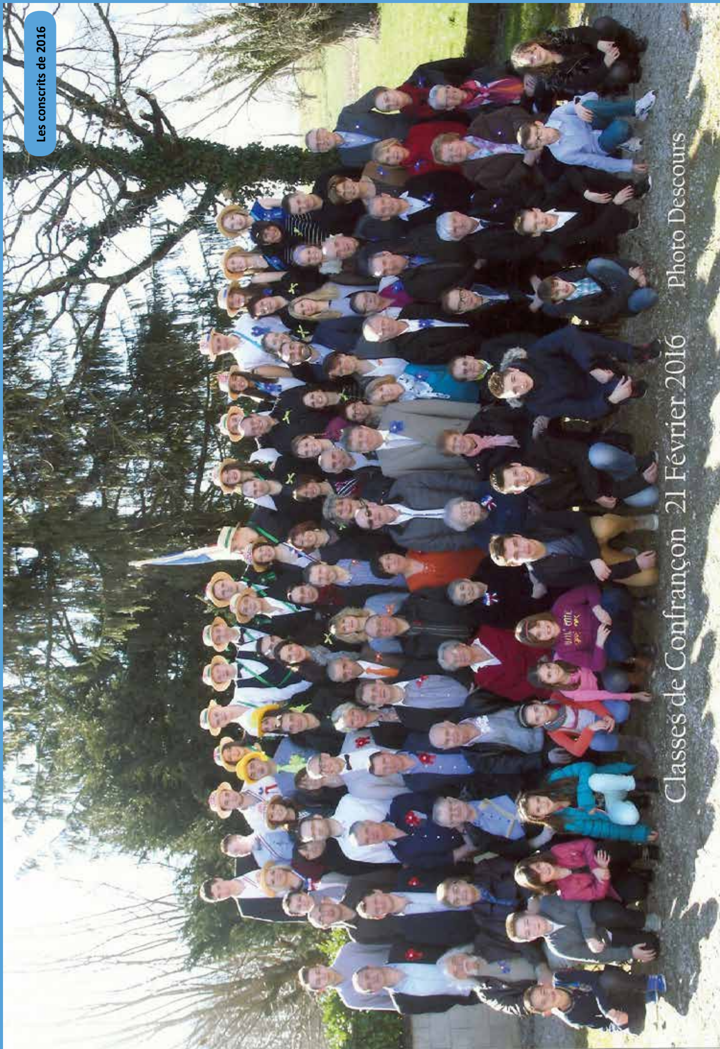
Classes de Confrancoñ 21 Février 2016