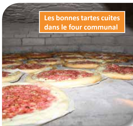
Les bonnes tartes cuites dans le four communal