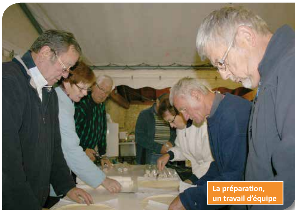
La préparation, un travail d'équipe

Nous vous donnons rendez-vous dès à présent les 7 et 8 octobre 2017 !