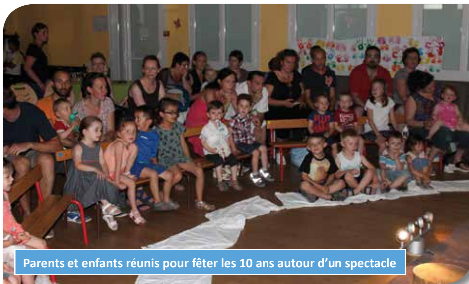
Parents et enfants réunis pour fêter les 10 ans autour d'un spectacle

La crèche est un service qui n'a plus besoin de démontrer son utilité. En 2015, elle a accueilli 53 enfants pour un taux d'occupation de 83,93%. Six agents y travaillent : trois auxiliaires de puériculture dont une intervient aussi à Montrevel, une éducatrice de jeunes enfants et deux agents titulaires du CAP petite enfance (l'une des deux pour 9h hebdomadaires seulement). La structure s'ouvre de plus en plus sur l'extérieur : vers l'école par la découverte des classes par les futurs élèves, vers les familles qui participent par des ateliers à la vie de la crèche.