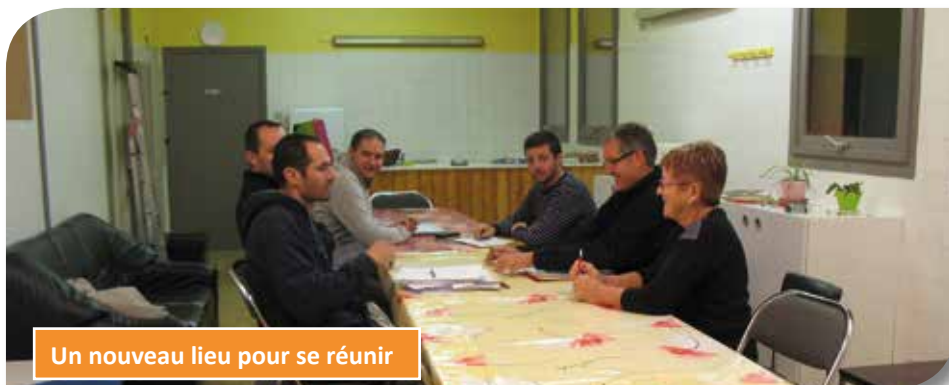
Un nouveau lieu pour se réunir

L'année 2016 a été une année importante pour le tennis à Confrançon, car les deux terrains ont fait l'objet de gros travaux : la surface de jeu est désormais en gazon synthétique sablé et l'un des deux terrains a été aménagé en City-stade accessible à tous. Ce dernier peut toutefois être utilisé par le club lors de compétitions ou d'en-