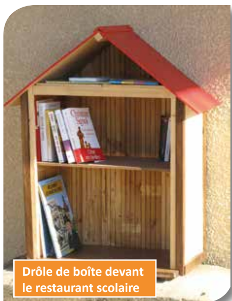
Drôle de boîte devant le restaurant scolaire